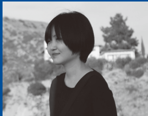
보선 | 일러스트레이터

일시. 6월 12일(금) 오후 7시 장소. 한길문고 문화공간(전북 군산시 하나운로 28, 2층)