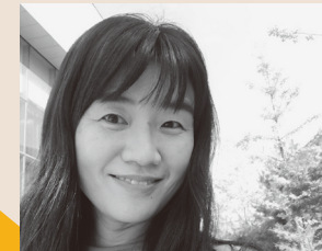
은유 | 글 쓰는 사람

일시. 6월 8일(월) 오후 7시 30분 장소. 벙커1(서울 서대문구 충정로 20)